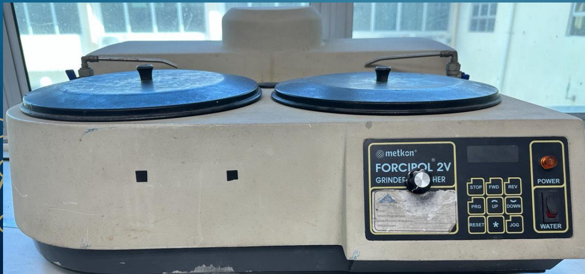
GRINDER AND POLISHER