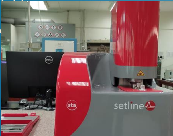
SIMULTANEOUS THERMAL ANALYSIS (STA)