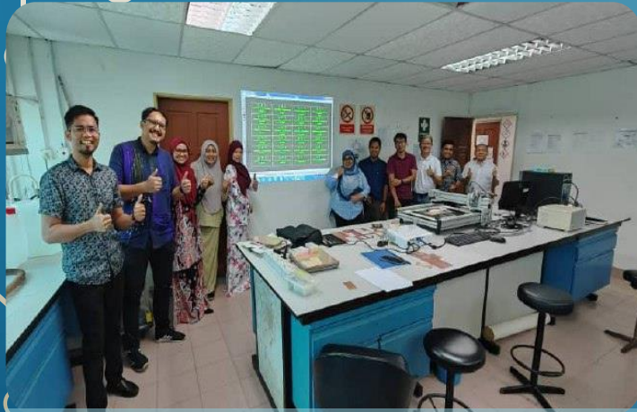
Sesi Latihan- Computer Controlled Drilling Machine 16 -18 Mei 2023