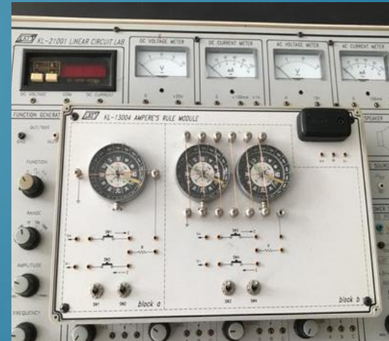
ELECTRIC BASIC TRAINING KIT