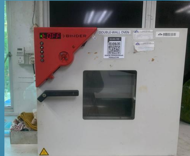
DOUBLE WALL OVEN