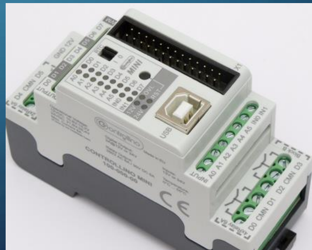
PLC TRAINING KIT