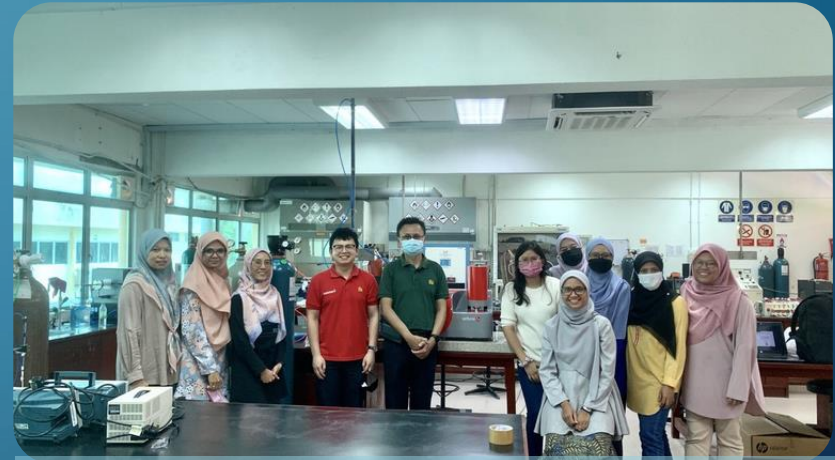
Sesi Latihan - Simultaneous Thermal Analysis 20 - 22 Jun 2022