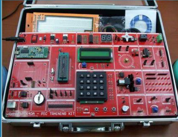
PIC TRAINING KIT